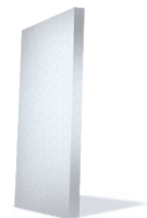
webertherm EPS-F Beli \lambda = 0.039 W/mK