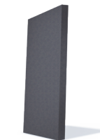
webertherm EPS-F Grafitni \lambda = 0.031 W/mK