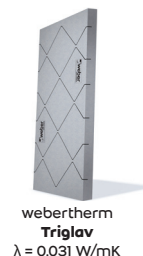
webertherm Triglav \lambda = 0.031 W/mK