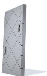
kalupna EPS-F stiroporna z diagonalnimi razbremenilnimi zarezi webertherm family Triglav 031 ( \lambda = 0,031 W/mK) (siva)