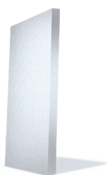
bela EPS-F stiroporna plošča webertherm family EPS-F 039, beli ( \lambda = 0,039 W/mK)