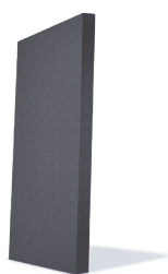
grafitna EPS-F stiroporna plošča webertherm family EPS-F 031, grafitni ( \lambda = 0,031 W/mK)