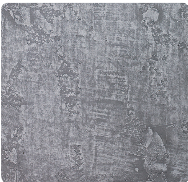
weberdesign beton – odtenek 1962C