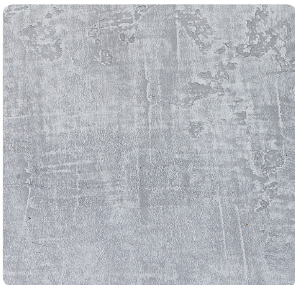
weberdesign beton – odtenek 1962D